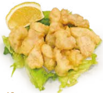
46 POLLO FRITTO fried chicken