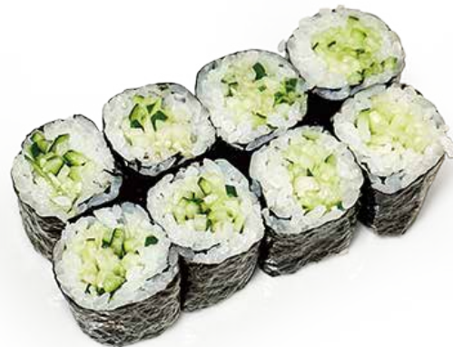
194 HOSSO KAPPA cetriolo