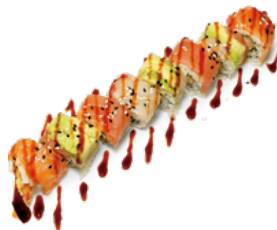
147 RAINBOW TEMPURA MAKI salmone*, tonno*, avocado, gambero* fritto, pesce* misto