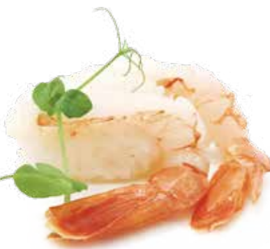
160 NIGIRI AMAEBI gambero crudo* a seconda della disponibilita di stagione