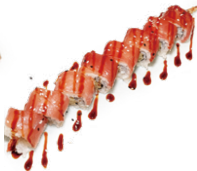
143 TEMPURA MAGURO MAKI tonno*, gambero* fritto, teriyaki