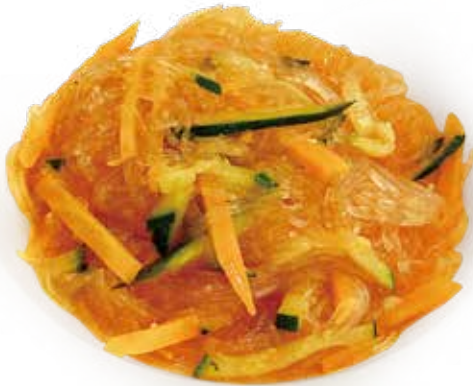
27 SPAGHETTI DI SOIA CON VERDURA soya noodles vegetable