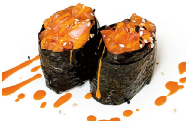
122 GUNKAN SPICY SALMON salmone* piccante