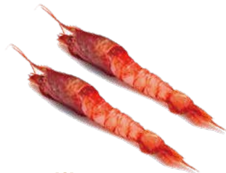
161 SASHIMI AMAEBI gambero* rosso 2pz a seconda della disponibilita di stagione