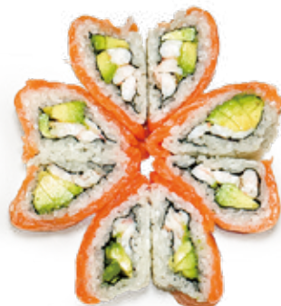
140 VALENTINO MAKI salmone*, gambero* cotto, avocado