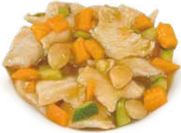
43 POLLO CON MANDORLA chicken and almonds