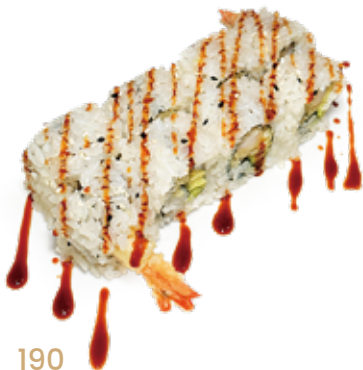
190 EBITEN MAKI gambero* fritto, avocado