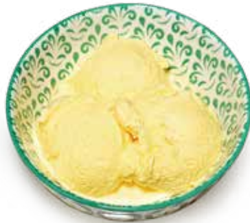
GELATO ALLA CREMA