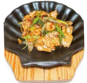
53 POLLO CON CIPOLLOTTI ALLA PIASTRA SPEZIATO spicy grilled chicken with spring onions