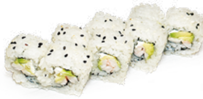
185 PHILADELPHIA URAMAKI philadelphia, gambero* cotto, avocado