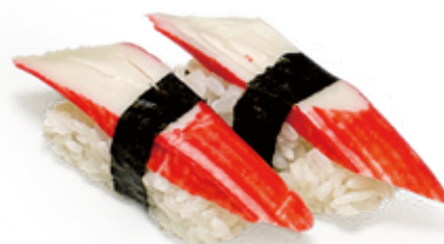
95 SURIMI NIGIRI surimi di granchio*