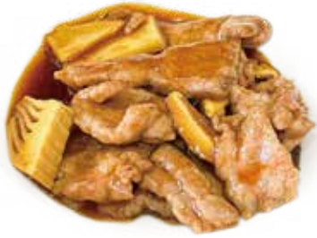
58 MANZO CON FUNGHI E BAMBU beef mushrooms and bambu