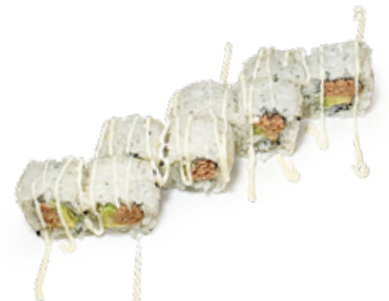
189 CALIFORNIA MAGURO URAMAKI COTTO tonno* cotto, avocado, maionese