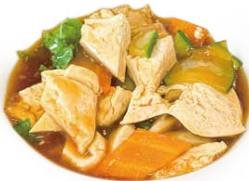
82 TOFU CON VERDURA bean curd with vegetable