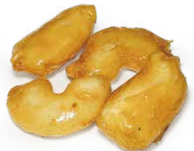
FRUTTA MISTA FRITTA O CARAMELLATO