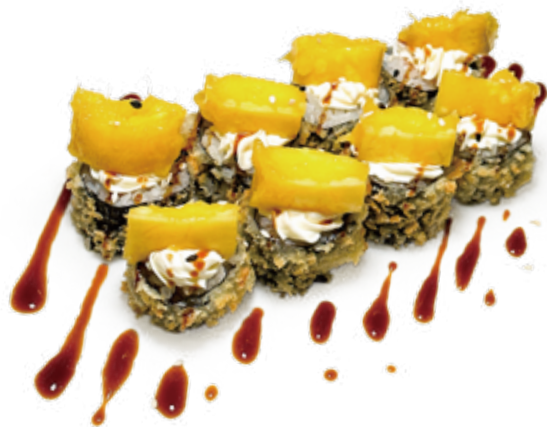
132 HOSSO MANGO hosomaki fritto salmone*, philadelphia, mango, teriyaki