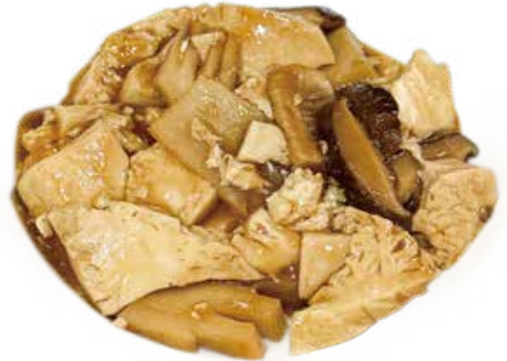
81 TOFU CON FUNGHI BAMBÙ bean curd with bambù mushrooms