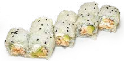
186 PHILA SAKE URAMAKI COTTO salmone* cotto, avocado, philadelphia