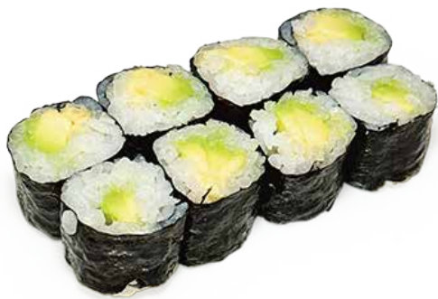
193 HOSSO AVOCADO avocado