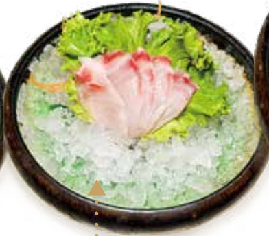
105 : SASHIMI BRANZINO branzino* 5pz