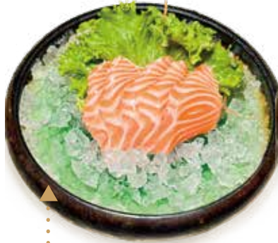
104 : SASHIMI SALMONE salmone* 5pz