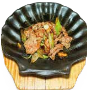
64 MANZO CON CIPOLLOTTI ALLA PIASTRA SPEZIATA beef broiled onions