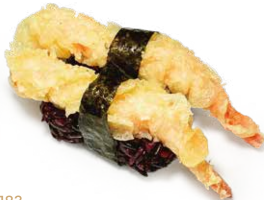
183 BLACK EBITEN NIGIRI riso venere, gambero* fritto