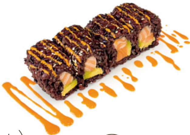
181 BLACK SPICY SAKE riso venere, salmone*, avocado, salsa piccante