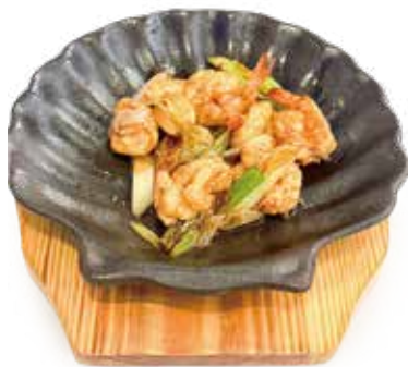
74 GAMBERI* CON CIPOLLOTTI ALLA PIASTRA SPEZIATO shrimp with broiled onions