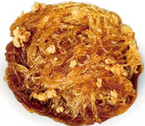
26 SPAGHETTI DI SOIA CON CARNE soya noodles with meat