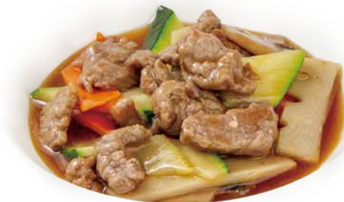
65 MANZO CON VERDURA beef vegetable