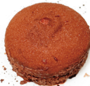
GELATO TARTUFO NERO CACAO ALLA CREMA