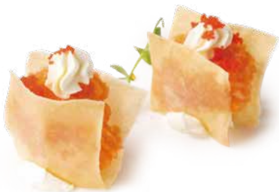
221 MILLE FOGLIE SAKE spicy salmone*, philadelphia, teriyaki