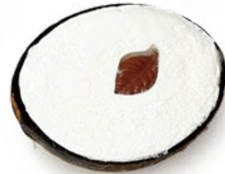
GELATO COCCO RIPIENO