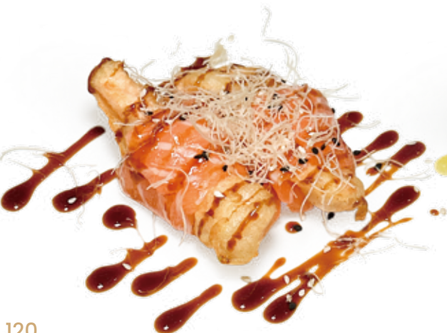
120 DUTOU TEMPURA SAKE salmone*, fritto, pasta kataifi