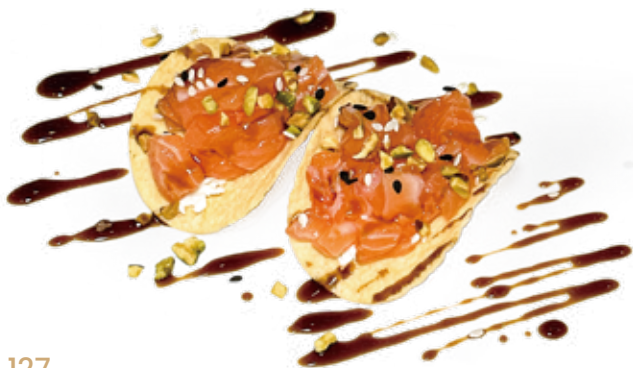
127 CRISPY PHILADELPHIA SALMON chips, salmone*, philadelphia, pistacchi, teriyaki