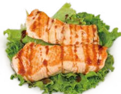
79 SALMONE* GRIGLIATO IN SALSA TERIYAKI grilled salmon sauce teriyaki