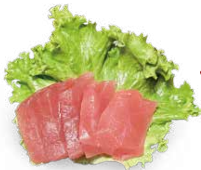
155 SASHIMI TONNO* 5PZ tonno

Max 2 piatti a scelta a persona tra questi proposti