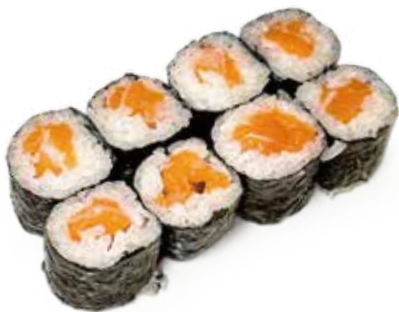
129 SAKE MAKI salmone*