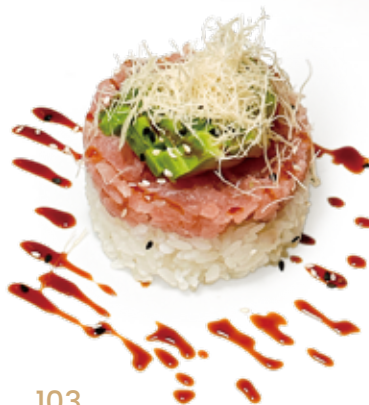
103 TARTARE TUNA CON RISO SPECIALE tartare tonno* con riso, avocado, teriyaki Max 1 porzione a persona