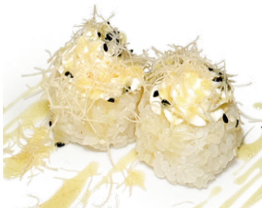
115 PHILADELPHIA NIDO philadelphia, riso, pasta kataifi, salsa esotica