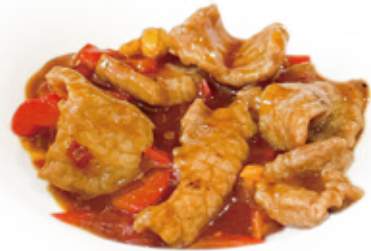
60 MANZO PICCANTE KUNG PAO spicy beef