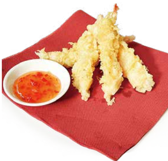
40 TEMPURA DI GAMBERI gamberi* in tempura fritti fried shrimp tempura