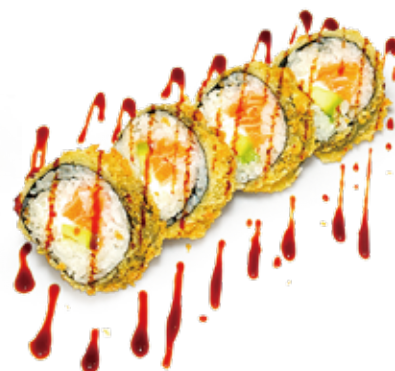
198 FUTOMAKI FRITTO futomaki fritto, salmone*, philadelphia, avocado