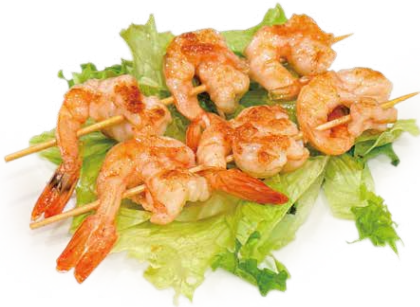
73 SPIEDINI DI GAMBERI* GRIGLIATI skewers shrimp