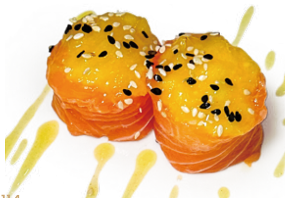
114 SALMONE MANGO HANA salmone*, mango, salsa mango