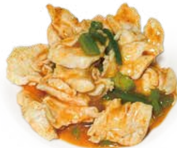
48 POLLO AL CURRY ROSSO TAILANDESE SPEZIATO chicken thai style