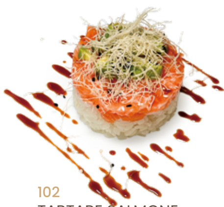
102 TARTARE SALMONE CON RISO SPECIALE tartare salmone* con riso, avocado, teriyaki