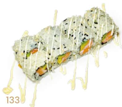
133 URA CALIFORNIA SAKE salmone*, maionese, avocado