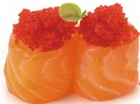
220 GIO TOBIKO salmone*, uova di pesce volante*