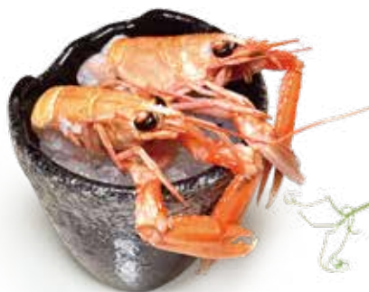
159 SCAMPI 2PZ* a seconda della disponibilita di stagione