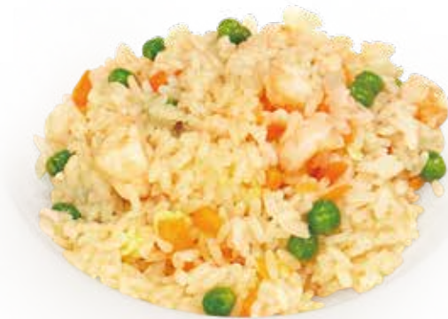
18 RISO CON GAMBERI* fried rice shrimp