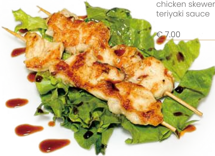
52 SPIEDINI DI POLLO IN SALSA TERIYAKI chicken skewers in teriyaki sauce