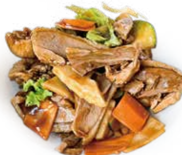
56 ANATRA CON VERDURA duck with vegetable