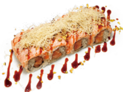
145 SAKE ROLL SCOTTATO salmone* scottato, pasta kataifi, pistacchio, teriyaki