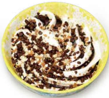
COPPA GELATO MONOCINA CIOCCOLATO PANNA