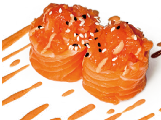
112 SAKE HANA salmone*, salsa sakura