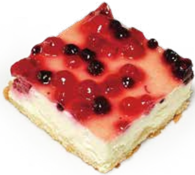
CHEESE CAKE DI FRUTTI BOSCO