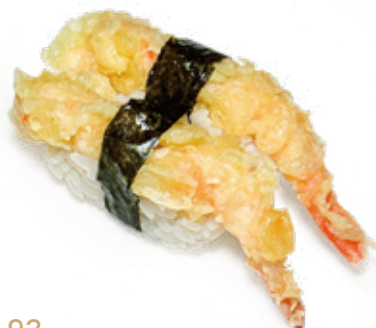
93 EBITEN NIGIRI gambero* fritto