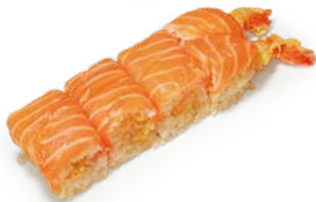
142 FRESH EBITEN ROLL salmone*, gambero* fritto