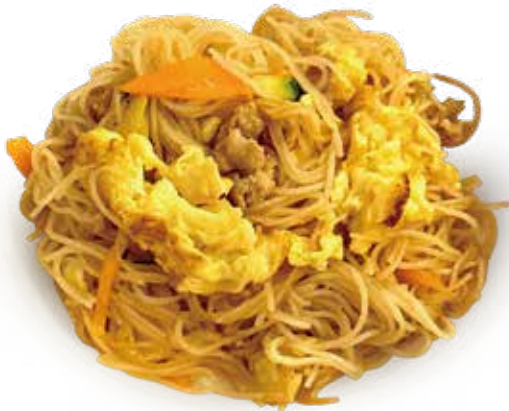
25 SPAGHETTI DI RISO CON CARNE E VERDURA rice noodles meat vegetable