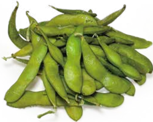
80 EDAMAME* fagiolini di soia japanese soy beans