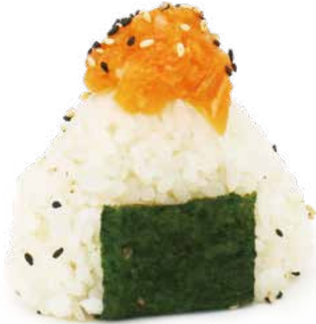
99 ONIGIRI SALMONE riso, salmone*, teriyaki