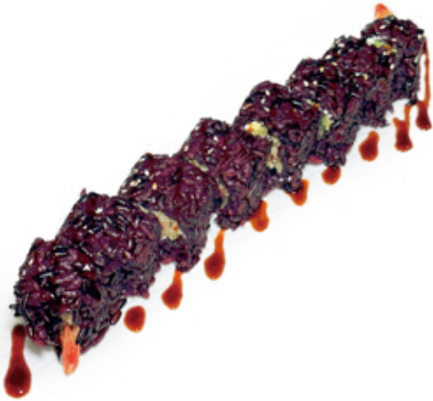
179 PHILA EBITEN BLACK riso venere, philadelphia, gambero* fritto, salsa teriyaki