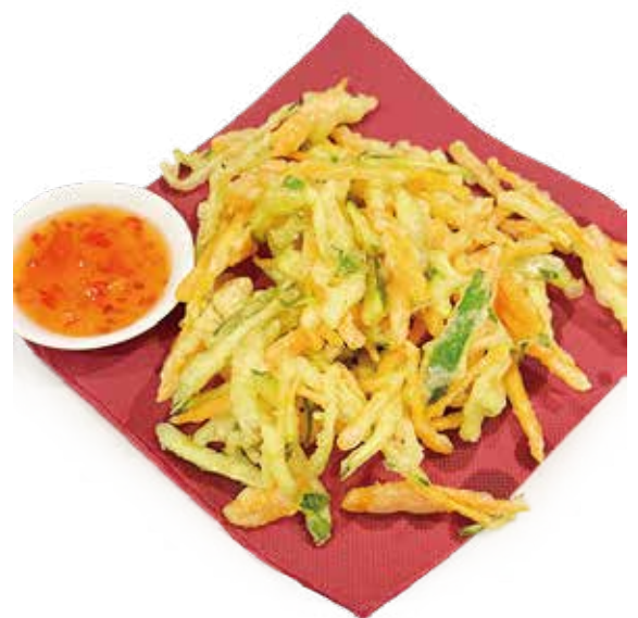
41 TEMPURA DI VERDURA MISTA tempura di verdura frita vegetable fried tempura