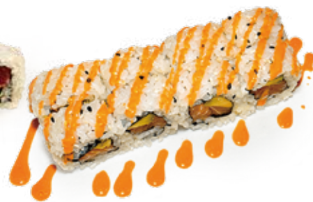
137 URA SPICY SAKE salmone*, avocado, salsa piccante