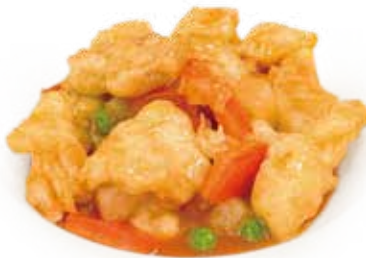
47 POLLO IN SALSA AGRODOLCE sweet and sour chicken