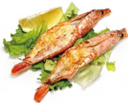
75 GAMBERONI* ALLA GRIGLIA grilled prawns