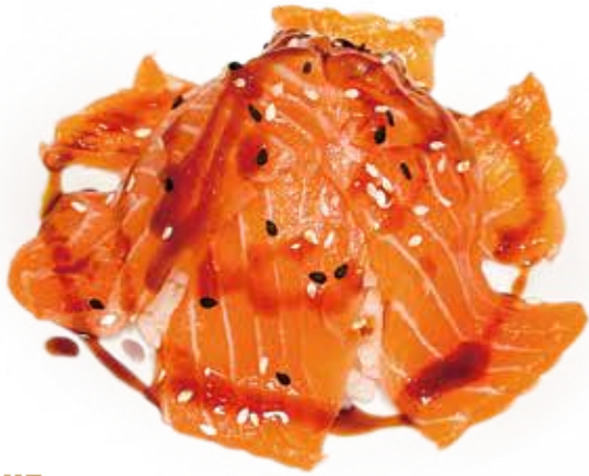
117 CHIRASHI SALMONE riso, salmone*, teriyaki