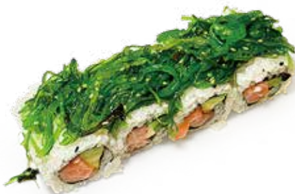
139 GREEN ROLL salmone*, alga wakame, avocado