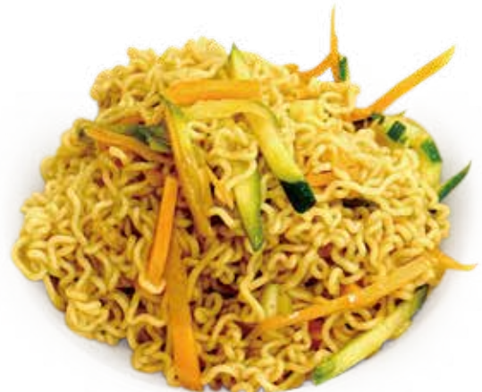
28 RAMEN CON VERDURA ramen noodles vegetable