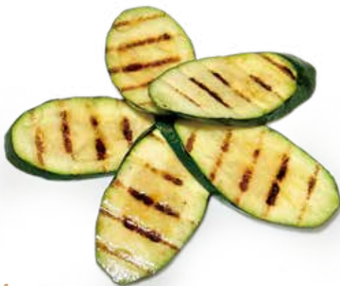
84 ZUCCHINE ALLA GRIGLIA grilled zucchini