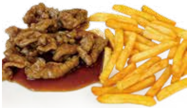
61 MANZO CON PATATINE FRITTE fried potatoes and beef