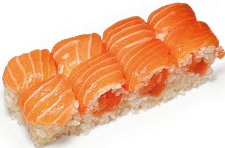
141 FRESH SAKE ROLL salmone*