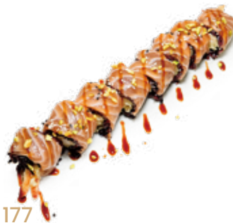
177 BLACK TEMPURA SAKE ROLL riso venere, salmone, gambero* fritto, pistacchio, salsa teriyaki