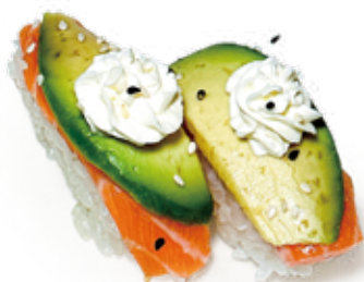
96 PHILADELPHIA SAKE NIGIRI salmone*, avocado, philadelphia