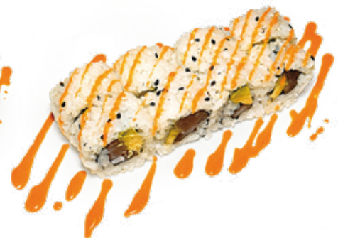
138 URA SPICY MAGURO tonno*, avocado, salsa piccante