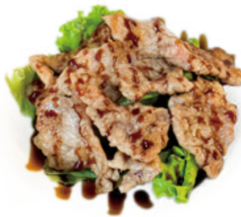
62 MANZO GRIGLIATO CON SALSA TERIYAKI grilled beef with sauce teriyaki