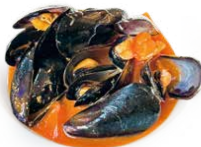
78 COZZE* ALLA MARINARA mussels marinara a seconda della disponibilit  di stagione