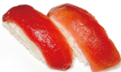
91 MAGURO NIGIRI tonno*