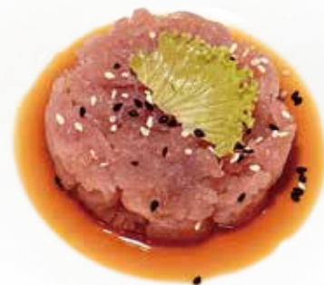
158 TARTARE TONNO* tartare tonno, salsa ponzu