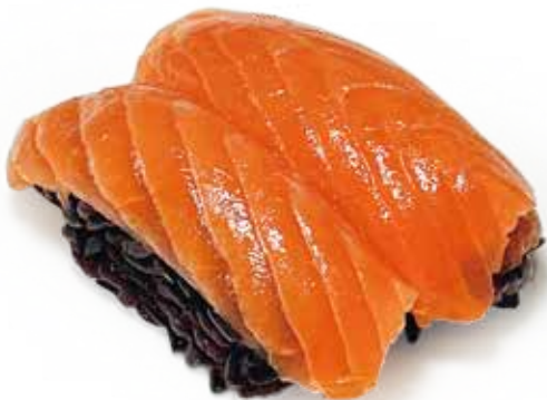
182 BLACK SAKE NIGIRI riso venere, salmone*