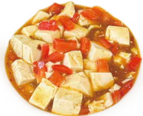
83 TOFU PICCANTE bean curd spicy