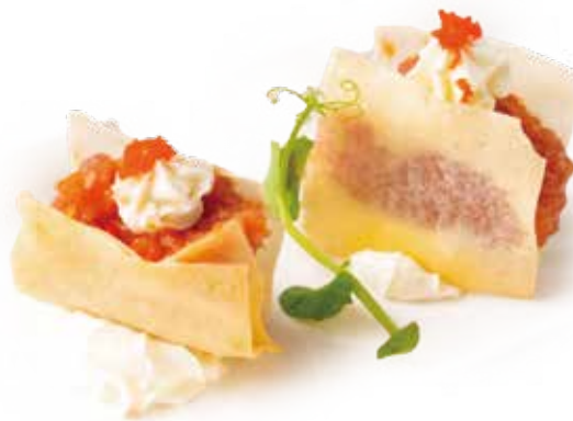
222 MILLE FOGLIE TUNA spicy tonno*, philadelphia, teriyaki