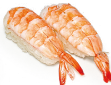
92 EBI NIGIRI gambero* cotto