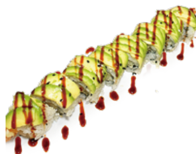
191 TIGER ROLL gambero* fritto, avocado, maionese