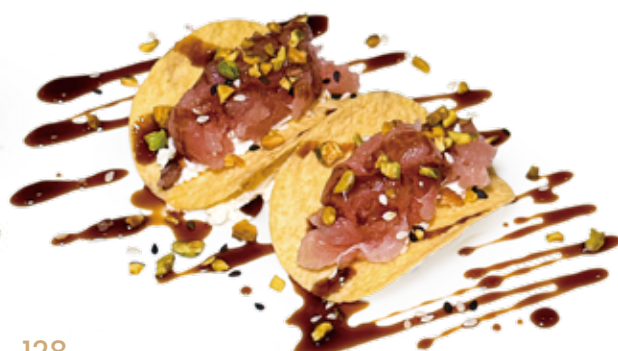
128 CRISPY PHILADELPHIA TUNA chips, philadelphia, tonno*, pistacchio, teriyaki Max 1 porzione a persona