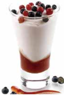
COPPA YOGURT CON FRUTTI DI BOSCO