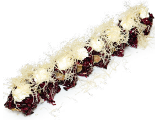
180 PHILADELPHIA BLACK riso venere, philadelphia, salmone* cotto pasta kataifi, avocado teriyaki