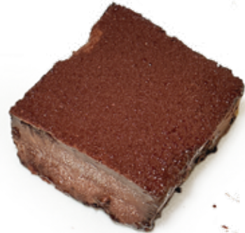
TORTA CHESSE CAKE AL CIOCCOLATO