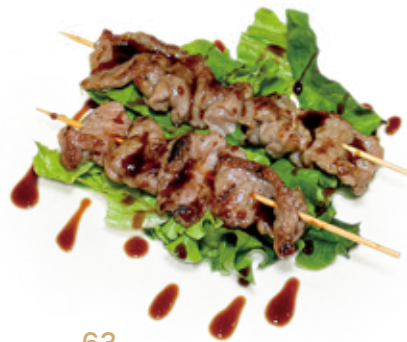
63 SPIEDINI DI MANZO IN SALSA TERIYAKI skewers beef teriyaki