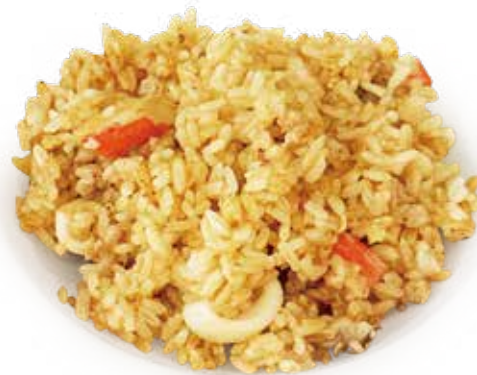
19 RISO CHAO LOU FAN fried rice chinese style