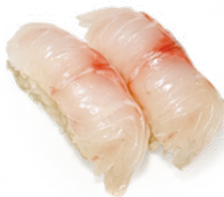
94 TAI NIGIRI branzino*