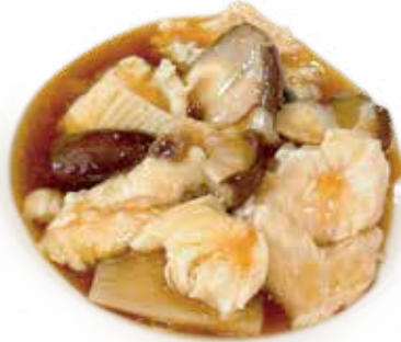
44 POLLO CON FUNGHI E BAMBU chicken mushrooms bamboo