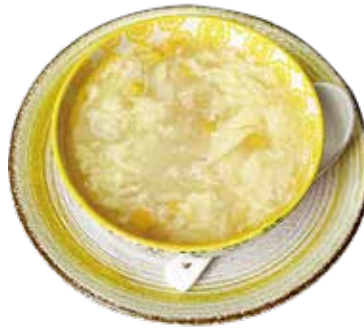
38 ZUPPA DI MAIS POLLO chicken corn soup