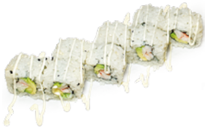
184 CALIFORNIA URAMAKI gambero* cotto, avocado, maionese