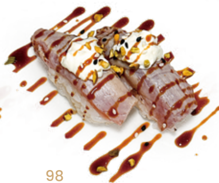
98 FLAMBE TUNA NIGIRI tonno* scottato, philadelphia, teriyaki, pistacchio Max 1 porzione a persona