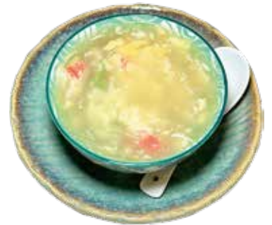
39 ZUPPA DI SURIMI E ASPARAGI soup surimi* and asparagus