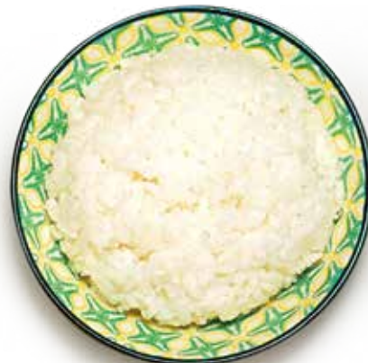
21 RISO BIANCO steamed rice