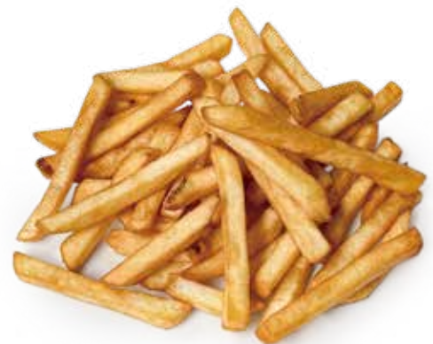
85 PATATINE FRITTE fried potatoes