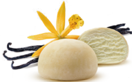
MOCHI GELATO 2PZ