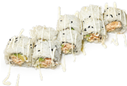
188 CALIFORNIA SAKE URAMAKI COTTO salmone* cotto, avocado, maionese