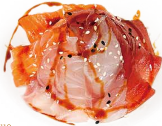
118 CHIRASHI MISTO riso, salmone*, tonno*, branzino*, teriyaki