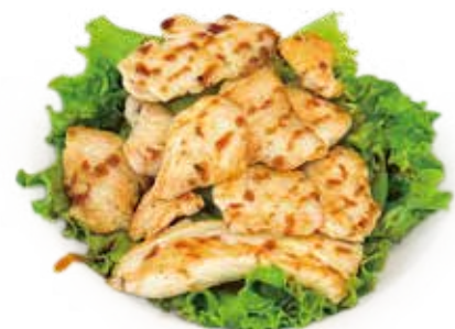
51 POLLO GRIGLIATO IN SALSA TERIYAKI grilled chicken teriyaki