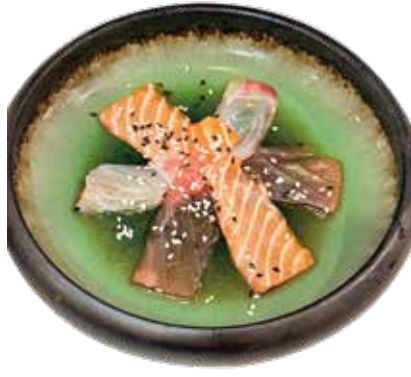
108 CARPACCIO MISTO carpaccio di salmone*, tonno*, branzino* con salsa ponzu