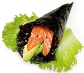
172 TEMAKI PHILADELPHIA SALMONE CON RISO VENERE riso venere, salmone*, avocado, philadelphia