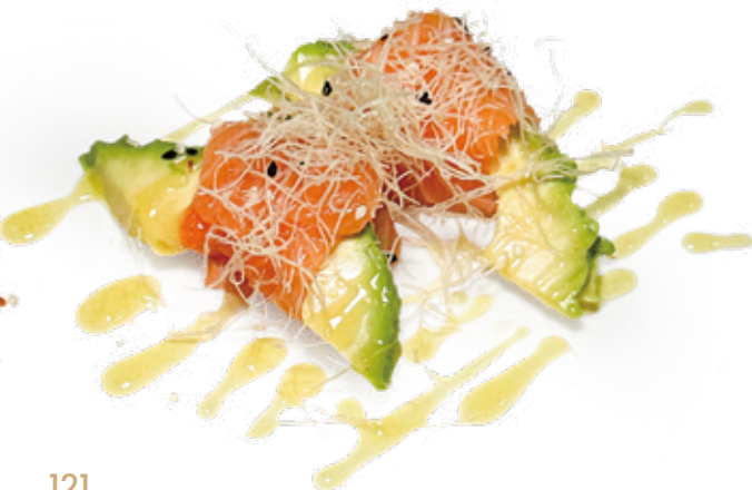
121 DUTOU AVOCADO salmone*, avocado, pasta kataifi, salsa esotica