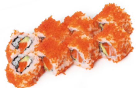
215 TOBIKO ROLL salmone*, avocado, uova di pesce* volante