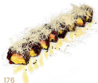
176 MANGO BLACK riso venere, mango, salmone*, pasta kataifi, salsa mango