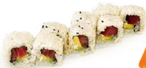
136 URA PHILADELPHIA MAGURO philadelphia, tonno*, avocado