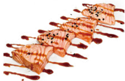
110 SALMONE SCOTTATO carpaccio di salmone* scottato, teriyaki Max 1 porzione a persona