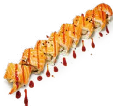
144 TEMPURA SALMONE MAKI salmone*, gambero* fritto, teriyaki