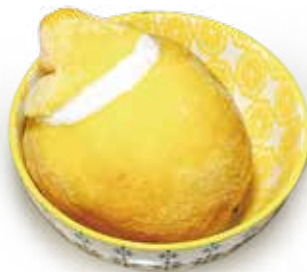
GELATO RIPIENO AL LIMONE