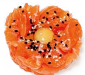
109 TARTARE SPECIALE tartare di salmone* con uovo di quaglia* Max 1 porzione a persona