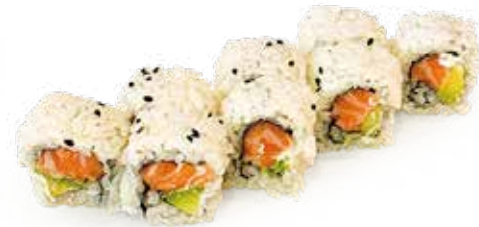
135 URA PHILADELPHIA SAKE philadelphia, salmone*, avocado