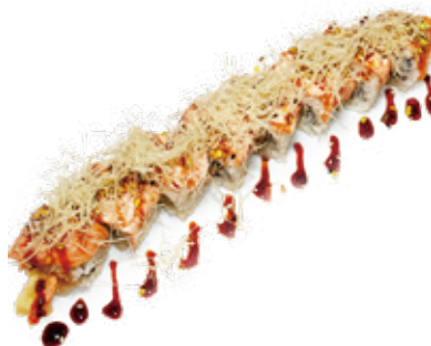
146 TEMPURA SAKE ROLL salmone* scottato, gambero* fritto, pasta kataifi, pistacchio, teriyaki