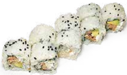
187 PHILA MAGURO URAMAKI COTTO philadelphia, tonno* cotto, avocado