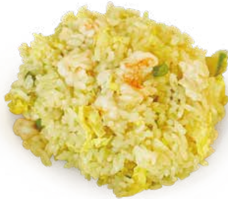
17 RISO CON GAMBERI* E POLLO ALLA THAILENDESE spicy fried rice