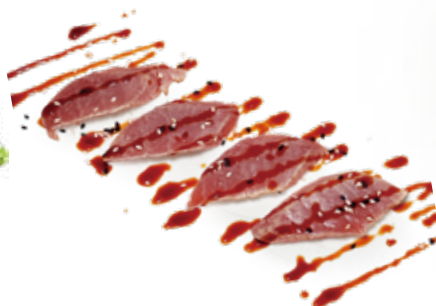
157 TONNO* SCOTTATO tonno scottato, teriyaki