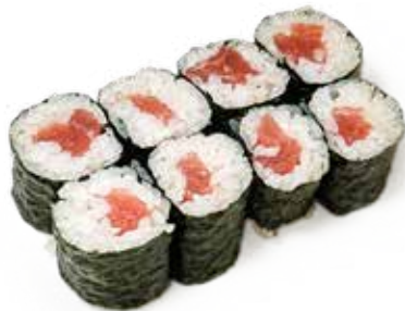
130 MAGURO MAKI tonno*