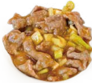
59 MANZO AL CURRY ROSSO TAILANDESE SPEZIATO curry thai style beef