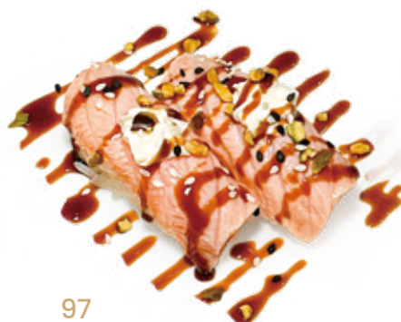
97 FLAMBE SALMON NIGIRI salmone* scottato, philadelphia, teriyaki, pistacchio Max 1 porzione a persona