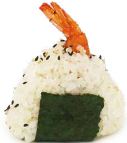
100 ONIGIRI EBITEM riso, gamberi* fritti, teriyaki