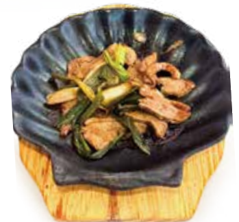
57 ANATRA CON CIPOLLOTTI ALLA PIASTRA SPEZIATO duck with broiled onions