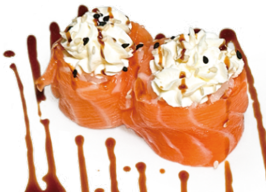
111 PHILADELPHIA HANA salmone*, philadelphia, teriyaki