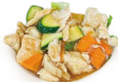
45 POLLO CON VERDURA chicken vegetable