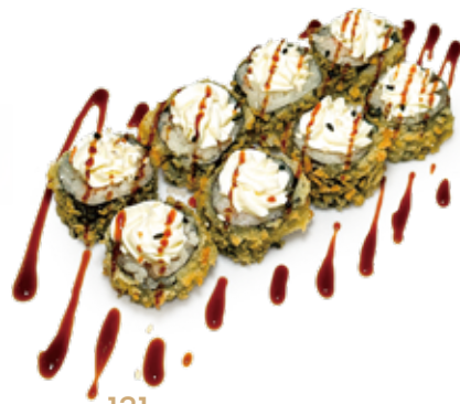
131 HOSSO MAKI FRITTO hosomaki fritto salmone*, philadelphia