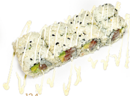
134 URA CALIFORNIA MAGURO tonno*, maionese, avocado