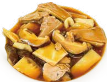
55 ANATRA CON FUNGHI E BAMBU duck mushrooms and bamboo