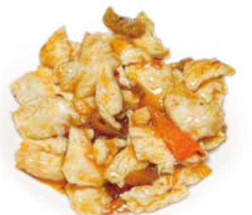
49 POLLO PICCANTE KUNG PAO spicy chicken