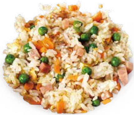
16 RISO CANTONESE cantonese style fried rice