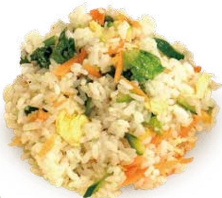
20 RISO CON VERDURE fried rice vegetable