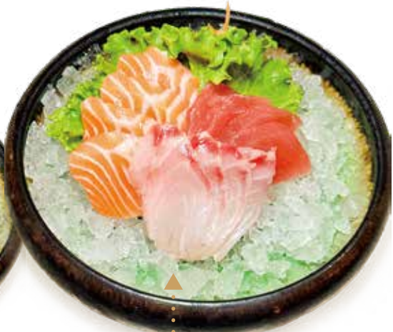
106 : SASHIMI MISTO tonno*, salmone*, branzino* 12pz