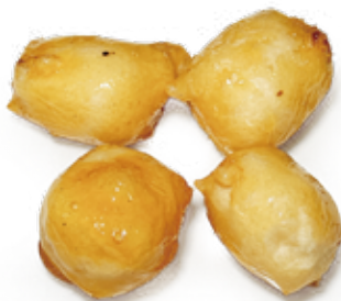
LATTE FRITTO O CARAMELLATO