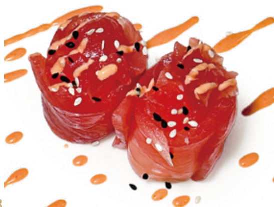
113 MAGURO HANA tonno*, salsa sakura