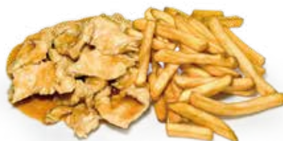
50 POLLO CON PATATINE FRITTE chicken with potato chips