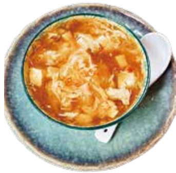
37 ZUPPA AGROPICCANTE hot and sour soup