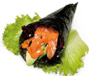
173 TEMAKI SPICY SALMONE CON RISO VENERE riso venere, salmone*, avocado, salsa piccante