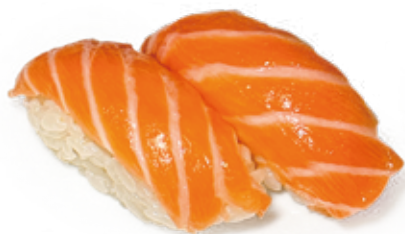
90 SAKE NIGIRI salmone*