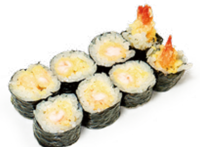
192 HOSSO EBITEN gambero* fritto, avocado, maionese