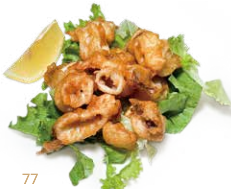
77 CALAMARI* FRITTI fried squid