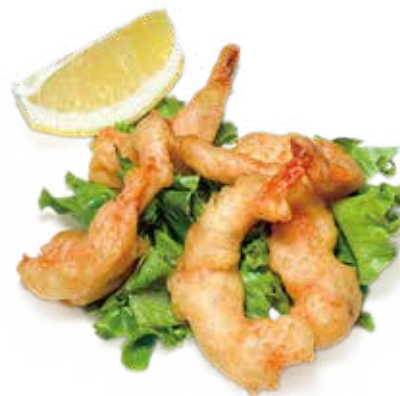
76 GAMBERI* FRITTI shrimp fried