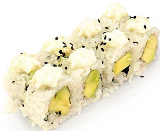
195 VEGETA ROLL philadelphia, avocado