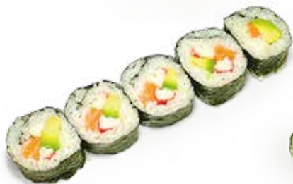
196 FUTOMAKI CALIFORNIA salmone*, avocado, surimi*, maionese