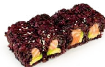
178 PHILADELPHIA BLACK URAMAKI SALMONE riso venere, philadelphia, salmone*, avocado