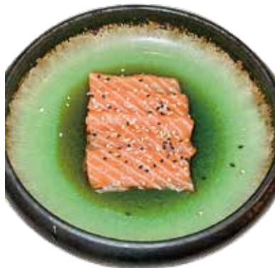
107 CARPACCIO DI SALMONE carpaccio di salmone* con salsa ponzu