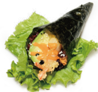
174 TEMAKI PHILADELPHIA GAMBERO FRITTO CON RISO VENERE riso venere, gambero* fritto, avocado