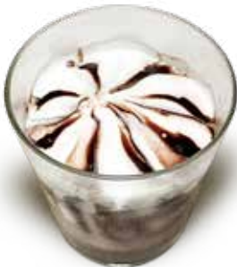
COPPA GELATO CIOCCOLATO FIORDILATTE