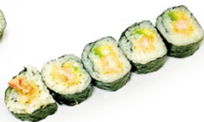
197 FUTO EBITEN gambero* fritto, avocado