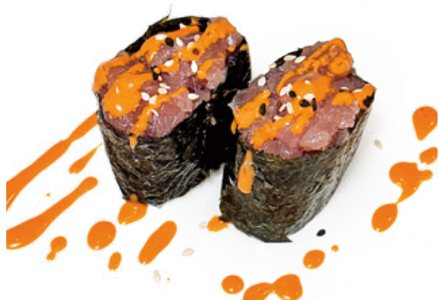
123 GUNKAN SPICY TUNA tonno* piccante